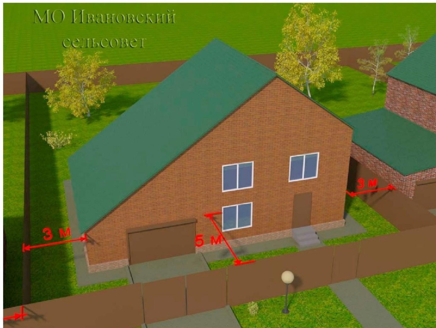
(рис.2) Для территориальной зоны – Ж; Ж-эк; Ж-эк2